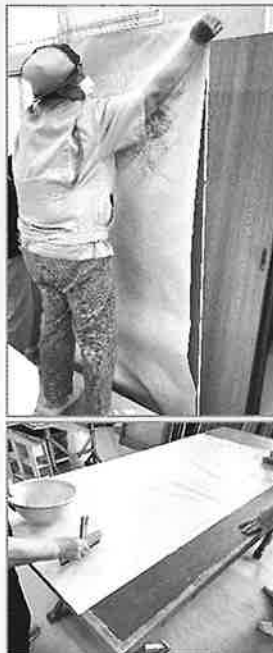
就労継続支援B型事業スクラム 令和7年度工賃向上計画

売上自体が下がっていることもあり、今年度よりイオン前沢店での販売会等、新しい取り組みを始め、目標を達成できるよう職員・利用者様が一丸となって取り組んでいます。