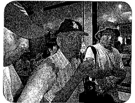
ワイナリーでは様々な種類のワ インを試飲しました。