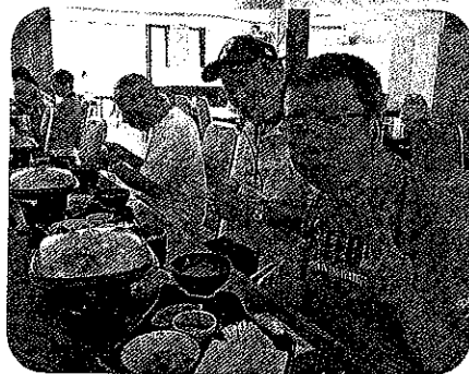
米沢牛をお腹いっぱい食べてき ました。おいしかったあ〜。