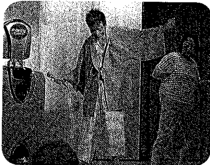
宴会でのカラオケは踊りつき♪ ステージいっぱいには踊りました

2年に一度おこなわれている研修旅行。今年 は7月12日~13日にかけて一泊二日で山形へ 行ってきました。帰りのバスでは利用者さん から「来週からのお仕事もがんばるぞ!」と いう言葉も聞かれ満足した表情で帰ってくる ことができました。